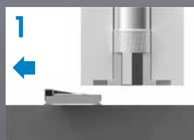
1 Дверь не зафиксирована

INOX304 Подходит для влажной уборки Корпус магнита, выполненный из нержавеющей стали AISI 304, устойчив к возникновению коррозии