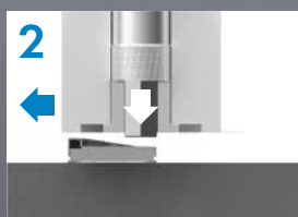
2 Магнит активирует штифт