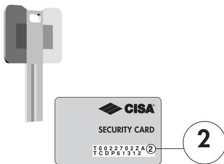
fig., abb., εικ., рис., 2